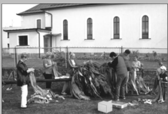
Stavanie mája v roku 2009

Ako na to: Dáme variť cestoviny podľa návodu. Očistíme papriky a spolu s rajčinou nakrájame na drobné kúsky. Cesnak pretlačíme a spolu o ostatnou zeleninou dáme na panvicu. Pridáme trošku oleja, vodu, /len toľko aby zelenina neplávala/, dochuťme vegetou a pridáme kôpor. Všetko dusíme, kým sa voda nevyparí, potom ešte pol minútky opečieme a všetko pridáme do misy s uvarenými cestovinami. Dochuťme kyslou smotanou /môžu byť aj dve/.