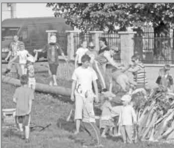
Stavanie mája 30. 4. 2013.