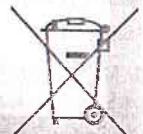
EEZ uvedené na trh pred 13. 8. 2015

Zber elektroodpadu sa musí vykonávať oddelene od zmesového komunálneho odpadu v členení podľa zberových skupín.